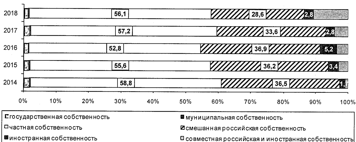
Структура объема отгруженных товаров собственного производства по формам собственности хозяйствующих субъектов за 2014-2018 гг. (в процентах к итогу)

За 2018 год отгружено товаров собственного производства, выполнено работ и услуг собственными силами на сумму 913,2 млрд. рублей , что в действующих ценах на 29,8% больше по сравнению с 2017 годом. В структуре объема отгруженных промышленных товаров собственного производства по формам собственности хозяйствующих субъектов наибольшая доля приходилась на предприятия частной формы собственности и предприятия смешанной российской формы собственности: