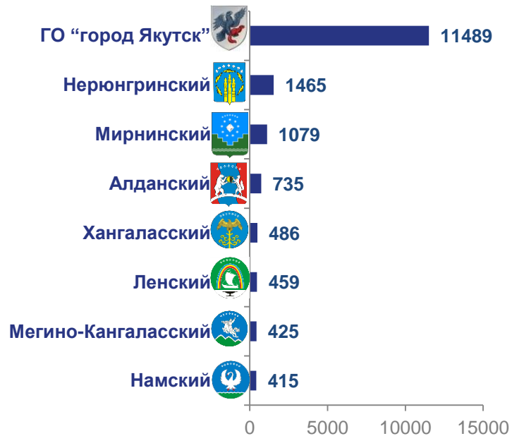
с наибольшими значениями

(выборка районов с наибольшими и наименьшими значениями, единиц)