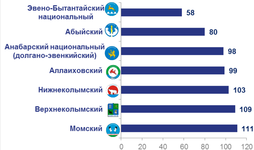
с наименьшими значениями